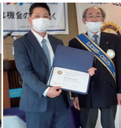
ポール・ハリスフェロー認定書授与 長野会員