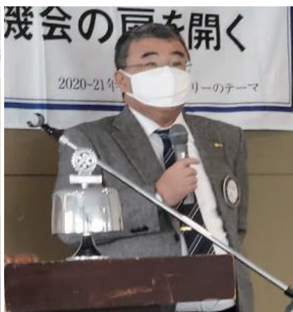
結婚記念お祝い 大家会員